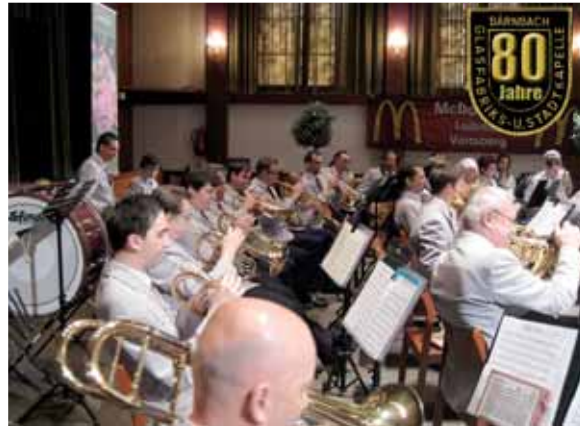
Zum Jubiläum in der Sporthalle geben sich im Herbst mehrere Kapellen ein musikalisches Stelldichein.

Am 8. Oktober 2011 mit Beginn 16:00 Uhr findet das 80-Jahr-Jubiläum in der Sporthalle Bärnbach statt. Ab 17 Uhr Konzert der Gastkapellen Werkskapelle Borkenstein-Neudau, Musikverein Spielberg, Bergkapelle Oberdorf Bärnbach, Musikverein MARAFOMARAFON aus Caorle. Ab 21:00 Uhr spielen die „Die Ligister“.