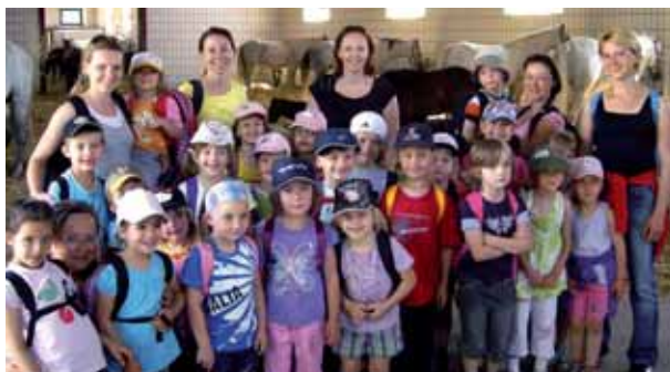
Beim Wandertag ins Gestüt Piber bekamen die Kinder einen Pferdepap, nachdem sie zuvor einige Rätsel gelöst hatten.

Einige Highlights des vergangenen Kindergartenjahres