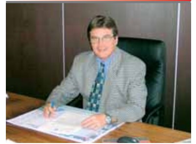
Bürgermeister Max Kienzer