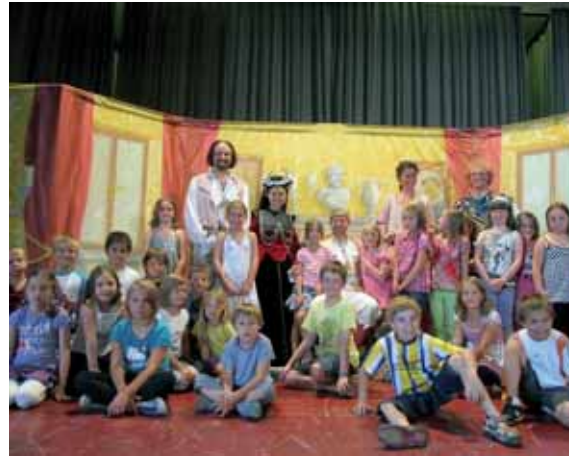
Die Wiener Kinderoper Papageno führte im Volkshaus das Stück „Papageno im Wunderland“ auf.

Für die Kinder der VS Bärnbach gastierte die Wiener Kinderoper Papageno mit dem Stück „Papageno im Wunderland“ im Volkshaus Bärnbach. Die Mädchen und Buben erlebten eine mitreißende Vorstellung.