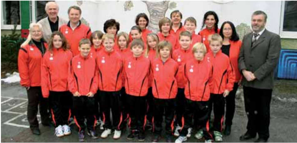
SchülerInnen und LehrerInnen der Sportklasse wurden von der Sparkasse Bärnbach mit neuen Trainingsanzügen eingekleidet.

Die Neue Mittelschule Bärnbach führt jeweils eine Klasse pro Schulstufe als Sportklasse mit zusätzlichen Sportstunden. So gibt es neben einer erweiterten allgemein sportlichen Ausbildung auch die Möglichkeit, Schwerpunkte in den Sportspielen Handball, Fußball und Volleyball zu setzen.