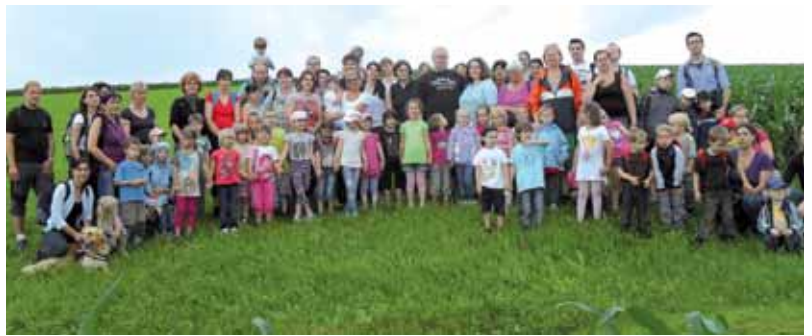
Im Juni waren die Kinder des städtischen Kindergartens viel unterwegs. Unter anderem wurde der Tierpark Herberstein besucht. Dabei hatten die Kinder die Möglichkeit, viele Tiere auch „hautnah“ kennenzulernen. Desweiteren wurde von den Kindergartenpädagoginnen ein Familienwandertag mit allen Kindern, Eltern, Großeltern, Freunden und Bekannten organisiert. Dabei wurde auch das Gelände des ehemaligen Tagbaues Oberdorf besucht.