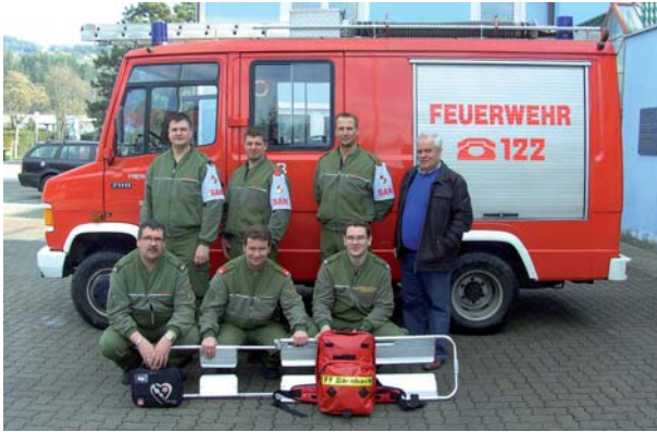
Zwei Trupps der FF Bärnbach nahmen an der Sanitäts-Leistungsprüfung in Tobelbad teil.

Die FF Bärnbach bedankt sich bei der Bevölkerung für den Besuch des Balls.