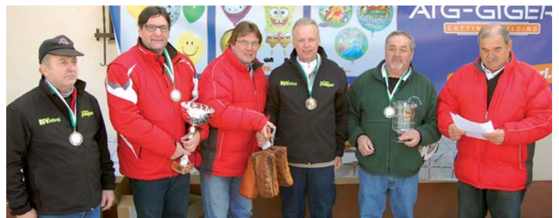
Die Vertreter des Kameradschaftsbundes waren auch mit dem Eisstock sehr zielsicher.

Am 29. Jänner 2011 fand das 6. Stadtpokalturnier der SPÖ Bärnbach im Eisstocksport auf der Eisanlage des ESV Bärnbach statt. Insgesamt haben 30 Moarschaften teilgenommen. Es siegten Vertreter des Kameradschaftsbundes Bärnbach vor den Vertretern des Siedlervereines Bärnbach und den Vertreterinnen des Bärnbacher Penisionistenverbandes.