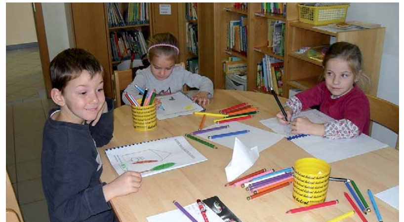
Bilderbuchwerkstatt im Städtischen Kindergarten – „Sehen-Lesen-Staunen“. Die Kinder wurden in ihrer Sprachkompetenz und in ihrer Sprechfreude bestärkt.

Von allen Sinnen, mit denen sich Kinder die Welt erschließen, kommt dem Sehen und Beobachten eine Schlüsselrolle zu. Bilder in Bilderbüchern tragen diesem Bedürfnis besonders Rechnung. Diese wollen vorgelesen, nach- oder weitererzählt werden. Begleitet von einem lesekompetenten Erwachsenen werden die Kinder in die Schriftsprache