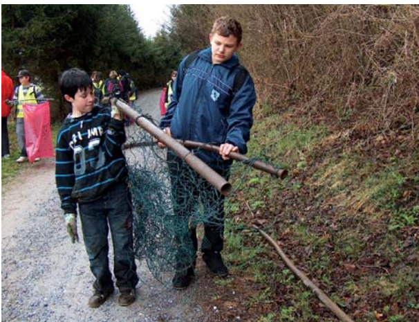
Schulen und Vereine werden unter Anleitung der Berg- und Naturwacht, Ortsgruppe Bärnbach, am Frühjahrsputz teilnehmen.

In enger Zusammenarbeit mit den Gemeinden, den Abfallwirtschaftsverbänden, den AbfallberaterInnen und mit Unterstützung durch Schulen und Vereine wird wieder eine breit getragene Mobilisierung unserer schönen Steiermark in der Zeit