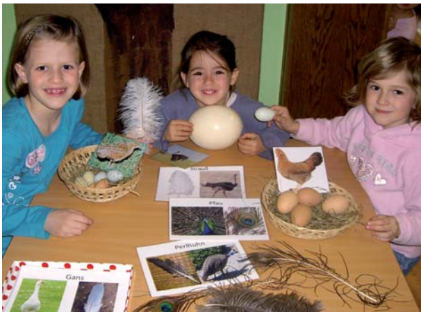
Die Kinder des Musik-Kindertages Krabambuli vergleichen die unterschiedlichen Eier und bestaunen das Straußenei

Kinder sind von Natur aus neugierig und die Vorgänge in der Natur interessieren sie ganz besonders. Deshalb hat das Team des Kindergartens Krabambuli einen neuen Forscher- und Entdeckerbereich eingerichtet. Hier erforschen die Kinder etwa Vorgänge wie die Entwicklung von der Knospe zur Blüte oder welches Ei zu welchem Tier gehört. Der neue Bereich ist bei den kleinen Wissenschaftlern besonders beliebt und wird ständig um interessante Inhalte erweitert.