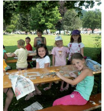
Weil das Interesse groß war, gibt es wieder die Aktion „Sommerferien für Kids“.