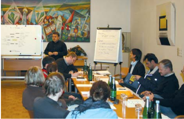
Entwickelt wurde der Leitbildentwurf „Bärnbach, die Wohn- und Kulturoase der Lipizzanerheimat.“ Dieser wird dem Gemeinderat zur Beschlussfassung vorgelegt.

Zahlreiche Ideen und Vorschläge wurden eingebracht