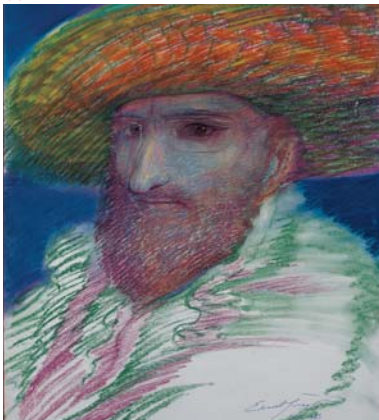
Selbstportrait mit Federhut.

Ernst Fuchs, 1930 in Wien geboren, schuf schon ab 1945 ein Oeuvre phantastischer Kunst, das sich, um Abstraktion und Moderne unbekümmert, aus alten Mythologien speist und nahtlos an Surrealismus und Symbolismus anknüpft.