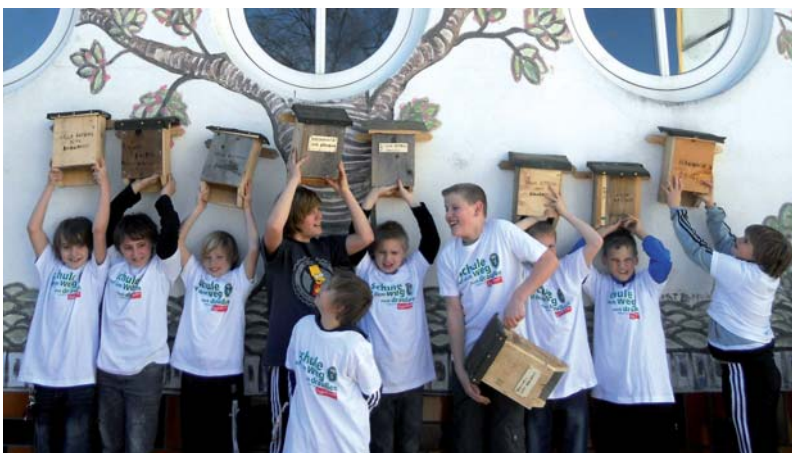
Klassenübergreifend arbeiteten die Werkgruppen der 1a- und der 1b-Klasse als Team an der Herstellung der Behausungen für die heimische Welt der „Flattertiere“.