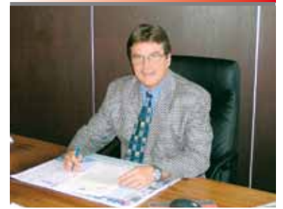
Bürgermeister Max Kienzer