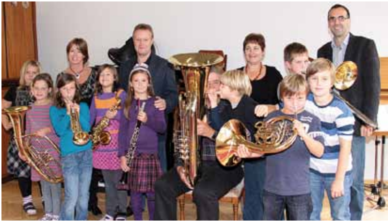
In der Volksschule I können die Kinder ein Orchesterblasinstrument erlernen