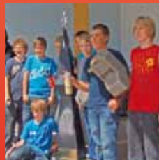
Interessierte Schüler der Hauptschule Bärnbach nahmen an dem Projekt „Nachhaltig Umweltschon“ teil. Seite 4