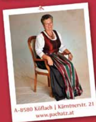
A-8580 Köflach | Kärntnerstr. 21 www.pachatz.at

Die Jury hat die Qual der Wahl bei so vielen hübschen Gesichtern!