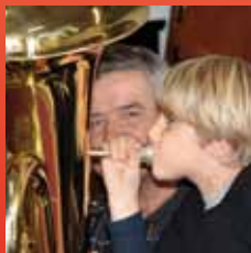
In der Volksschule in Bärnbach können Kinder während des Unterrichts ein Blasinstrument erlernen. Seite 4