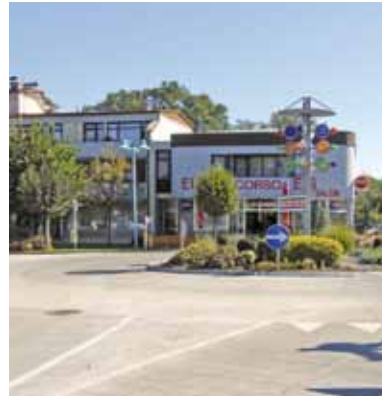
Nach den Umbauarbeiten erstrahlt der Bärnbacher Hauptplatz in neuem Glanz.

Der Straßenbelag des Bärnbacher Kreisverkehrs befand sich bereits in einem äußerst schlechten Zustand. Nachdem schon mehrfach bei der zuständigen Landesrätin die Sanierung des Kreisverkehrs eingefordert wurde, wurde im Sommer mit den Sanierungsarbeiten begonnen. Außerdem wurde der Radius des Kreisverkehrs vergrößert und die Fahrbahn im Kreis und Richtung Afling kommend mit einer Betondecke versehen. Die Umbauarbeiten konnten vor Schulbeginn abgeschlossen werden. Die Kosten betrugen rund 115.000,-,-.