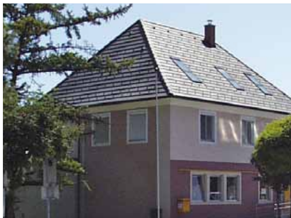
Die Bärnbacherinnen und Bärnbacher hoffen, dass das Postamt nunmehr doch erhalten bleibt.

Im Juni 2010 wurde die Stadtgemeinde Bärnbach von der Post informiert, dass die Schließung der Post am Standort Hauptstraße 14 beabsichtigt ist. Gleichzeitig wurde der Stadtgemeinde Bärnbach mitgeteilt, dass die Postfiliale durch einen sogenannten Postpartner ersetzt werden soll. Die Vorbereitungsarbeiten zum Ersatz der Postfiliale durch einen Postpartner wurden über die Sommermonate soweit vorangetrieben, dass der Postpartner Anfang September die Postfiliale ersetzen sollte.