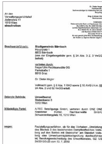
Beschwerde der Stadtgemeinde Bärnbach im Feststellungsverfahren.

gestellt und angeregt eine Vorabentscheidung beim Europäischen Gerichtshof einzuholen. Bgm. Max Kienzer: „Mittlerweile wurde uns eine Verfügung des Verwaltungsgerichtshofs übermittelt mit der der belangten Behörde, also dem Umweltsenat, und der mitbeteiligten Partei A-TEC Beteiligungs GmbH, aufgetragen wird, binnen 8 Wochen eine Gegenschrift zu erstatten und ihr Gelegenheit gegeben wird, zum Antrag auf aufschiebende Wirkung binnen vier Wochen Stellung zu nehmen.“