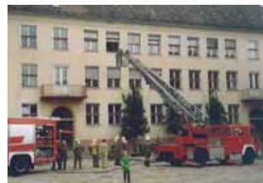
Schüler, Eltern und Lehrer sammelten sich vor dem Schulhaus.