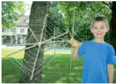
An den Nachmittagen haben die Kinder verschiedene Kunstwerke aus den mitgebrachten Naturmaterialien gebastelt.