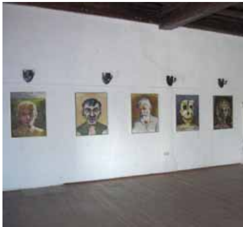
Werke aus dem Nachlass von Albert Pohl im Schloss Alt-Kainach.