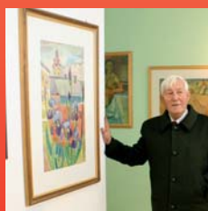
In der ehemaligen Tregister Volksschule wurde kürzlich das Franz Weiß Museum eröffnet. Seite 6