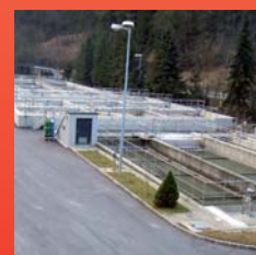
Auf Grund des Umbaus der Verbandskläranlage muss die Kanalgebühr erhöht werden. Seite 10