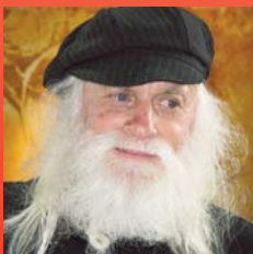
Der Künstler Horst Rainer trat von Af- fling aus seine erfolg- reiche Künstlerkar- riere an. Seite 3