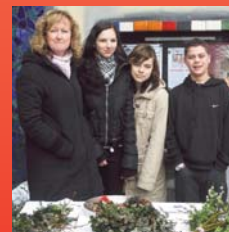
Von SchülerInnen angefertigte Palm- buschen wurden zu Gunsten der Caritas verkauft. Seite 8