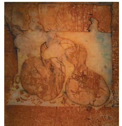
Textil gerostet, coloriert