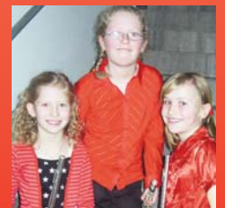
Schülerinnen der Musikschule waren beim Wettbewerb Prima la Musica erfolgreich. Seite 9