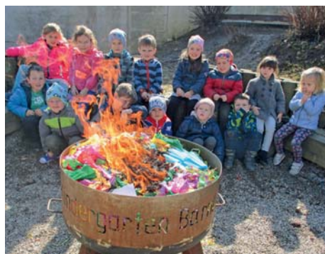
Der Umgang mit Feuer inkl. Sicherheitsinfos wurde verantwortungsvoll weitergegeben.