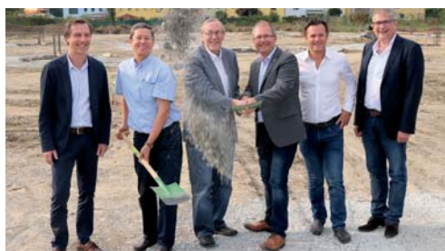
Auf den ehemaligen ÖDK-Gründen erfolgte 2018 der Spatenstich für das neue Fachmarktzentrum – die Eröffnung folgt in Kürze.