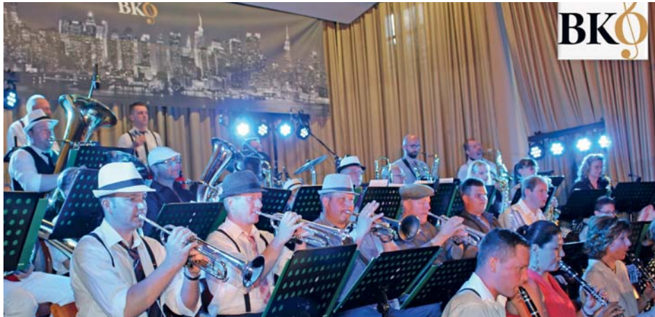
Die Musikerinnen und Musiker der BKO freuen sich auf Ihren Besuch beim „Swing&More“ am Samstag den 25. Mai im Volkshaus Bärnbach