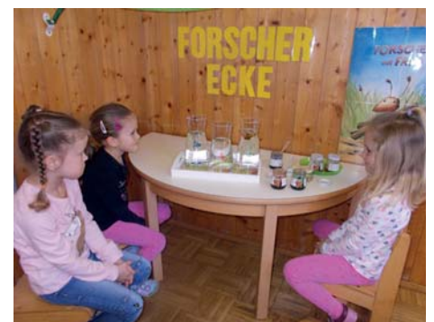
Forschen und experimentieren mit Farben faszinierte die Kinder ganz besonders.