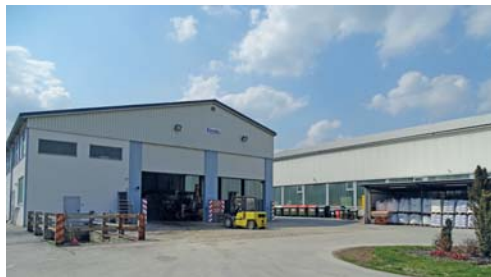
Ein Meilenstein der letzten fünf Jahre: 2017 wurde der neue Bau- und Wirtschaftshof seiner Bestimmung übergeben.