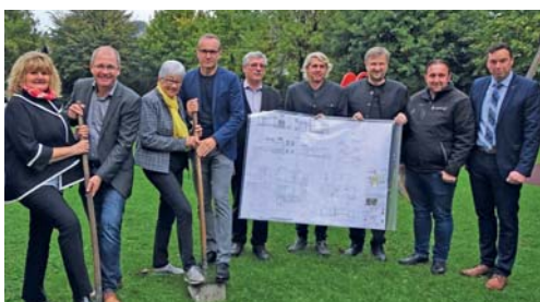
2018 konnte mit der umfangreichen Sanierung der Volks- und Musikschule Bärnbach begonnen werden. Mit der Fertigstellung ist im Herbst 2019 zu rechnen.