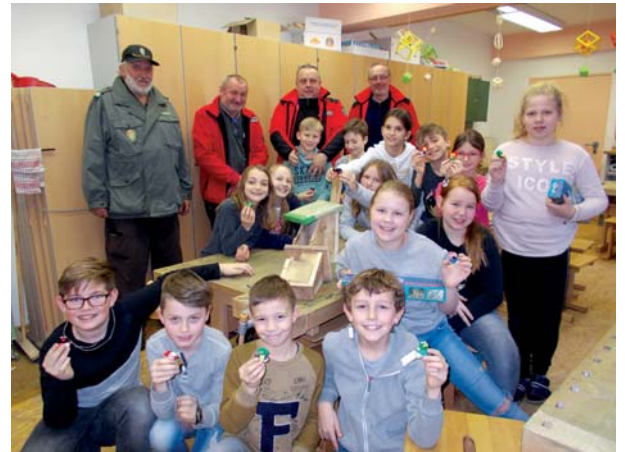
Schülerinnen und Schüler halfen beim Bau von Nistkästen

Kürzlich haben fünf Berg- und Naturwächter der Einsatzstelle Bärnbach in der VS Afling noch einmal fünf Nistkästen und zehn Fledermauskästen fertig zusammengesraubt. Fünf Kästen wurden im Schulhof an den Bäumen angebracht. Am 27. Februar wurden zehn Fledermauskästen und 20 Nistkästen aufgehängt. Die erfreuliche Bilanz: Insgesamt wurden vier Großaktionen in Kooperation mit der VS Afling umgesetzt. Die SchülerInnen sowie auch die Lehrerin halfen fleißig mit.