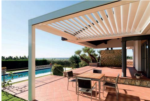
Poier Sonnenschutz, Kleegasse 5 – 8572 Bärnbach 0676 51 14 234 – office@poier-co.at – www.poier-co.at

Markisen, Glasdächer, Pergola, Rollläden, Raffrollos...