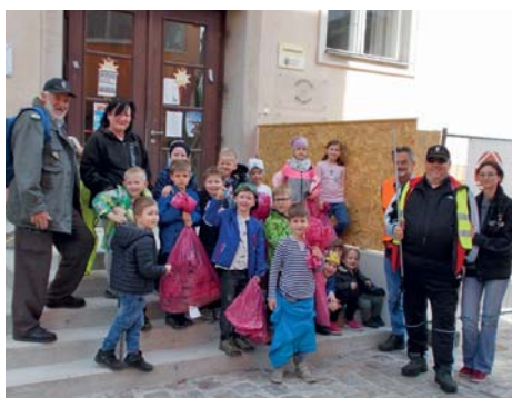
Schüler und Schülerinnen der VS Bärnbach unterstützten die Berg- und Naturwacht.