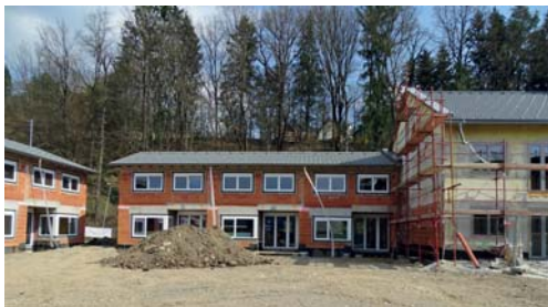
Aktuell werden in Bärnbach rund 100 Wohneinheiten errichtet – zwanzig davon am ehemaligen Bau- und Wirtschaftshof.